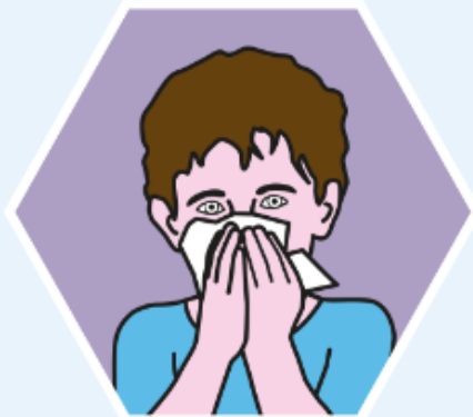
IN EIN PAPIERTASCHENTUCH