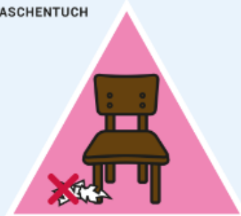
NICHT RUMLIEGEN LASSEN