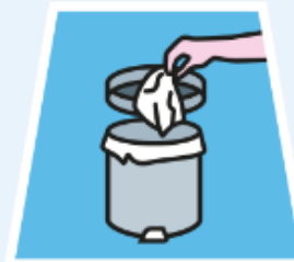
IN DEN MÜLLEIMER WERFEN