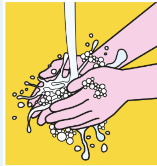
HÄNDEWASCHEN NICHT VERGESSEN